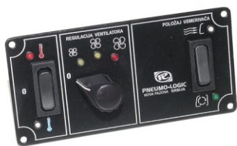
Komandni modul (vozača)