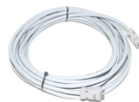
Komandni kabl sa konektorima (dužina L=7000mm)