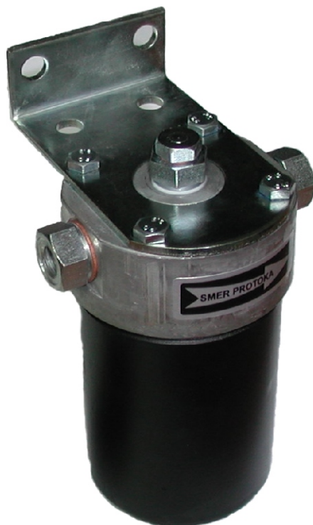
Filter goriva, komplet OZNAKA: 140.708