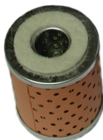
Uložak filtera (Ø51x64) OZNAKA: 140.716