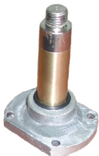
Jezgro elektromagneta, OZNAKA: 700.07.00

U regulator temperature ugradjuju se dve membrane 600.04.00, i jedna membrana 700.05.00.