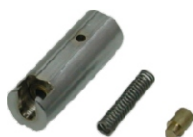
Kotva sa oprugom i regulacionim klipom,komplet OZNAKA: 700.06.00 (stara oznaka: EMV-700.036)