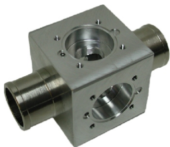
Telo regulatora temperature, komplet (priključak Ø38mm) OZNAKA: 600.03.00