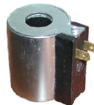
Kalem elektromagneta, (namotaj) OZNAKA: 700.08.00 (stara oznaka: EMV-700.034)